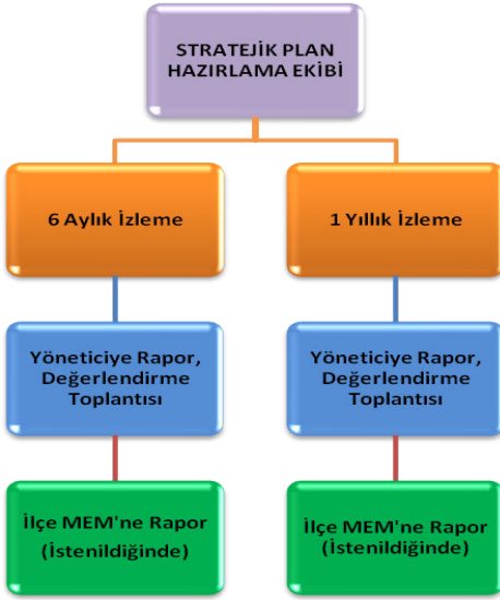
Tablo 26: İzleme ve Değerlendirme Şablonu

Müdürlüğümüzün 2024-2028 Stratejik Planı İzleme ve Değerlendirme sürecini ifade eden İzleme ve Değerlendirme Modeli hazırlanmıştır. Müdürlüğümüzün Stratejik Plan İzleme- Değerlendirme çalışmaları eğitim-öğretim yılı çalışma takvimi de dikkate alınarak 6 aylık ve 1 yıllık sürelerde gerçekleştirilecektir. 6 aylık sürelerde Üst Yöneticiye rapor hazırlanacak ve değerlendirme toplantısı düzenlenecektir. İzleme-değerlendirme raporu, istenildiğinde Stratejik Geliştirme Başkanlığına gönderilecektir. Ayrıca ilimizin Mülki İdari Amirine sunulacaktır. 1 yıllık izleme-değerlendirme çalışmaları, Stratejik Planımızda yer alan hedeflerin yıllık düzeyde ifade edildiği Performans Programı ve yılsonunda gerçekleşme düzeylerinin belirlendiği Faaliyet Raporu hazırlanarak yapılacaktır. Performans Programı ve Faaliyet Raporu Üst Yöneticinin değerlendirmesinin akabinde Strateji Geliştirme Başkanlığına ve Mülki İdari Amire sunulacaktır. Yıllık izlemelerle ilgili değerlendirme toplantıları düzenlenecektir.